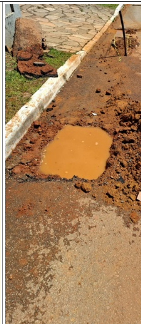
Imagem 3: Outro vazamento do lado direito da rua