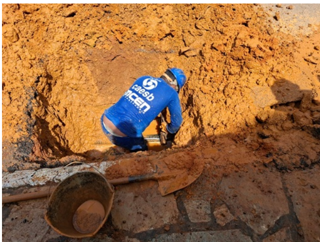
Imagem 1: Técnico da Caesb arrumando vazamento do lado esquerdo da rua

3. Foram observados quatro buracos expostos no asfalto, que não haviam sido recompostos após reparos anteriores, corroborando o relato da síndica de atraso no cronograma de recuperação asfáltica.