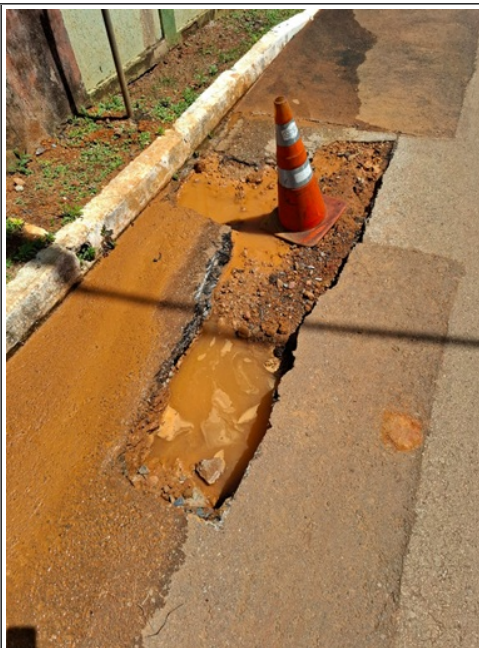
Imagem 2: Vazamento do lado direito da rua